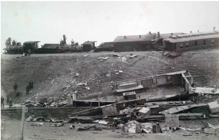
фотография А.М. Иванецкого